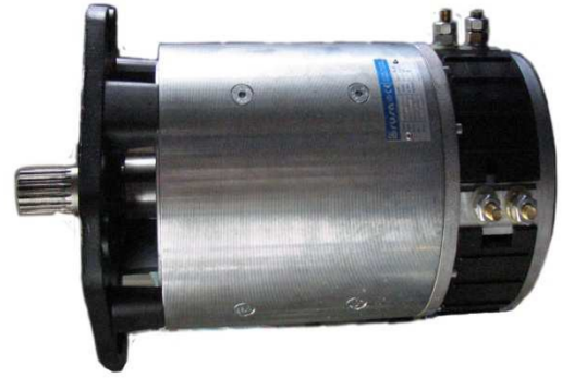
Es. motore serie M (ex. M series motor)